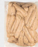
Колбаски для гриля Pollo

арт.: 72956 • в/у, колбасок 4 шт вес – 380 г 30 суток, 0°C +6°C