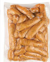
Колбаски для гриля

арт.: 76545 • в/у, 1 кг длина ~8 см диаметр ~17 мм вес 1 шт 19-21 г 180 суток, -18°C