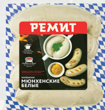
Колбаски белые Мюнхенские

арт.: 84358 • в/у, вес 1 уп – 400 г 30 суток, 0°C +6°C